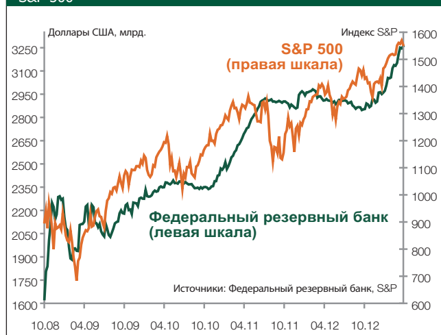
Балансовый итог Федерального резервного банка и индекс S&P 500

В том, что касается портфелей ценных бумаг, мы по-прежнему отдаем предпочтение компаниям с высоким статусом, а также крупным компаниям, представленным на мировом рынке. Выбранные нами компании действуют на рынке с высокими входными барьерами и, следовательно, имеют отлаженные денежные потоки, что позволяет им выплачивать высокие, растущие дивиденды. Области экономики, которые интересуют нас в первую очередь, – это промышленность и технологии, однако, многообещающими являются также сферы потребления и здравоохранения.